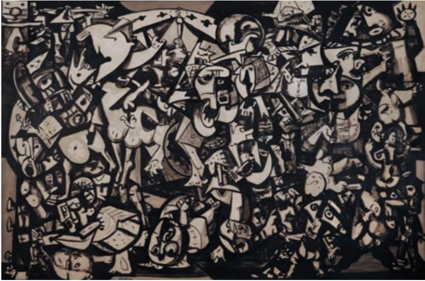
O mundo, 1964.Óleo sobre lienzo. Colección particular, Madrid.

El estilo del Laxeiro argentino mantiene una enorme fidelidad a los temas gallegos de su formación, pero va a sufrir una intensa evolución formal