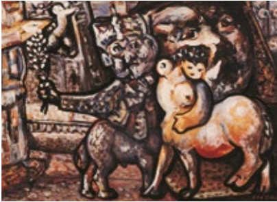
Centaura, 1961. Óleo sobre cartón. Colección ABANCA.

O estilo do Laxeiro arxentino mantén unha enorme fidelidade aos temas galegos da súa formación, pero vai sufrir unha intensa evolución formal motivada polo ambiente cosmopolita