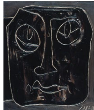
Retrato , 1960-70. Óleo sobre lenzo. Colección privada.

or O martirio do boneco Ramón (1966); the paintings most representative of his 60s and 70s period, such as O Mundo (1964) or Retrato (1960-1970); works illustrative of the significant decomposition of faces, Foi un home (1963), Xefe Azteca (1964) or O Espanto (1962); and a recreation of the Galician art exhibition of 1951 in Buenos Aires with Rúas de Vigo (1948) by Carlos Maside.