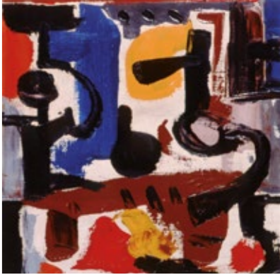
Bailaríns, 1969. Tinta